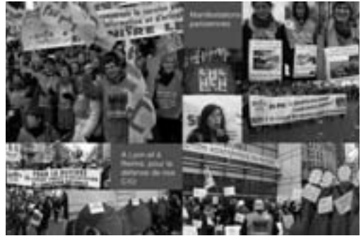
Combats au quotidien

► L'arrêté définissant les modalités et le contenu de formation , présenté en CTM le 16 novembre, ne contenait rien des garanties que la FSU attend sur les horaires, les contenus, les modalités pratiques de la formation. La FSU intervient pour que la DGSIP (1) respecte la note de cadrage actée par le cabinet le 20/07/2016. Les arguments avancés sont d'ordre financier. Pourtant, comment, à budgets constants, les crédits alloués pour deux ans de formation de CO-Psy stagiaires et un an de préparation au DEPS